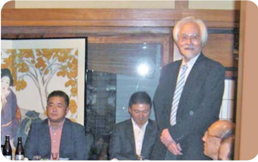
審査員の黒岩会員