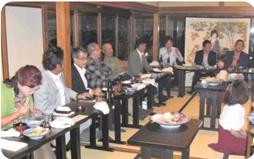
会員皆さん楽しく観月会を過ごされました