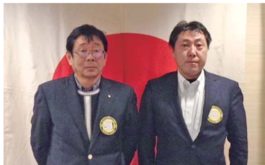
一力次年度副会長、沼田次期副幹事