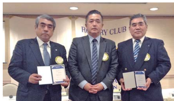
米山功労者になられた荒金会員、瑞木会員に感謝状贈呈