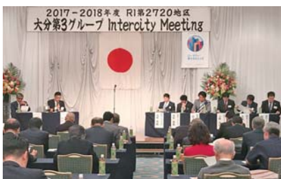
パネルディスカッション風景