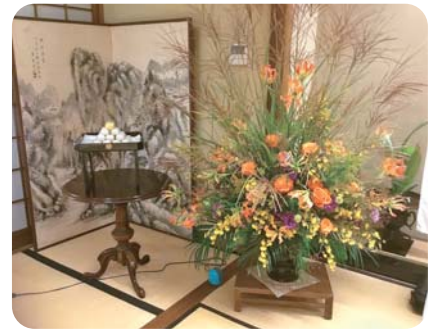
RYOフローリストの花・茶郎の月見だんご