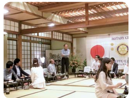
樽谷会員による閉会の挨拶・万歳