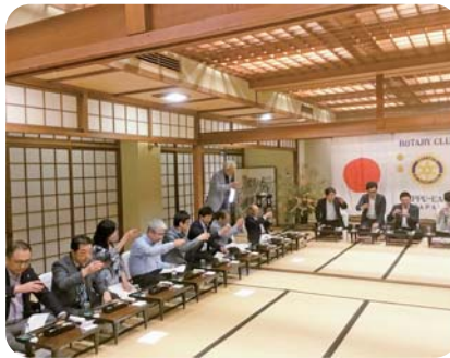
黒岩会員による乾杯