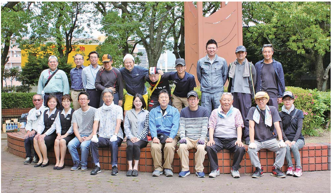
清掃活動に参加された会員の皆様!!